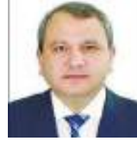
Elçin Babayev Bakı Dövlət Universitetinin rektoru