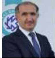
Hüsniyə Kəpə Qars Qafqaz Universitetinin rektoru