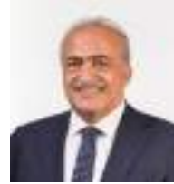
Ömer Çomaklı Atatürk Universitetinin rektoru