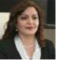
Aygün Attar TC Güvenlik ve Dış Politikalar Kurulu Üyesi