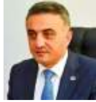
Anar Bağirov Azərbaycan Respublikası Vəkillər Kollegiyasının sədri