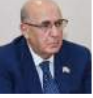
Əhliman Əmiraslanov Milli Məclisin deputatı